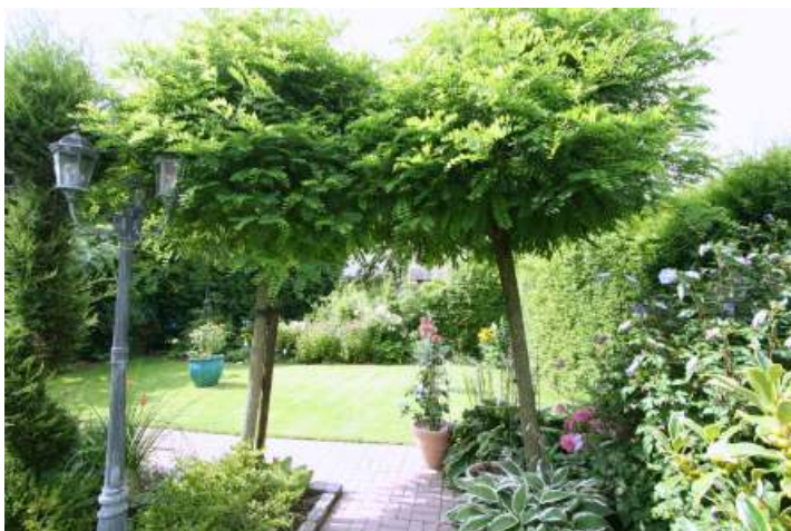
Foto - Blick in den schönen Garten.

Foto - Der Eingang zum Garten ist gesäumt von zwei Kugel- bäumen.