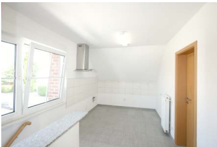
Foto - Die Küche als zentraler Raum.